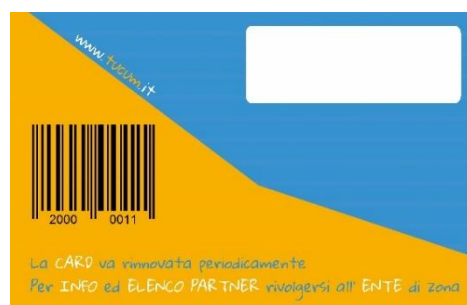
(Fronte e retro della Tessera)

Allo stesso tempo le attività che aderiscono, vengono sostenute nel loro lavoro e possono partecipare più attivamente al Progetto applicando sconti e avendo la possibilità di seguire con maggiore attenzione gli stessi clienti beneficiari durante i loro acquisti. Grazie alla tecnologia utilizzata, per contrastare eventuali abusi , il negoziante è in grado di verificare l'identità del cliente beneficiario confrontando la foto registrata nel chip della tessera ad ogni utilizzo della stessa.