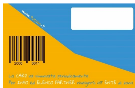
(Fronte e retro della Tessera)

Allo stesso tempo le attività che aderiscono, vengono sostenute nel loro lavoro e possono partecipare più attivamente al Progetto applicando sconti e avendo la possibilità di seguire con maggiore attenzione gli stessi clienti beneficiari durante i loro acquisti. Grazie alla tecnologia utilizzata, per contrastare eventuali abusi , il negoziante è in grado di verificare l'identità del cliente beneficiario confrontando la foto registrata nel chip della tessera ad ogni utilizzo della stessa.